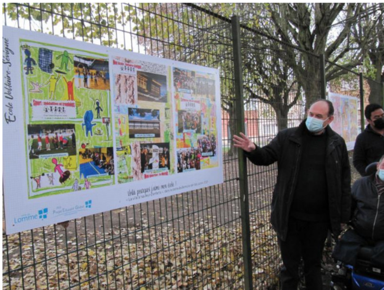
Le directeur de l'école Voltaire-Sévigné a présenté les panneaux réalisés par les enfants.