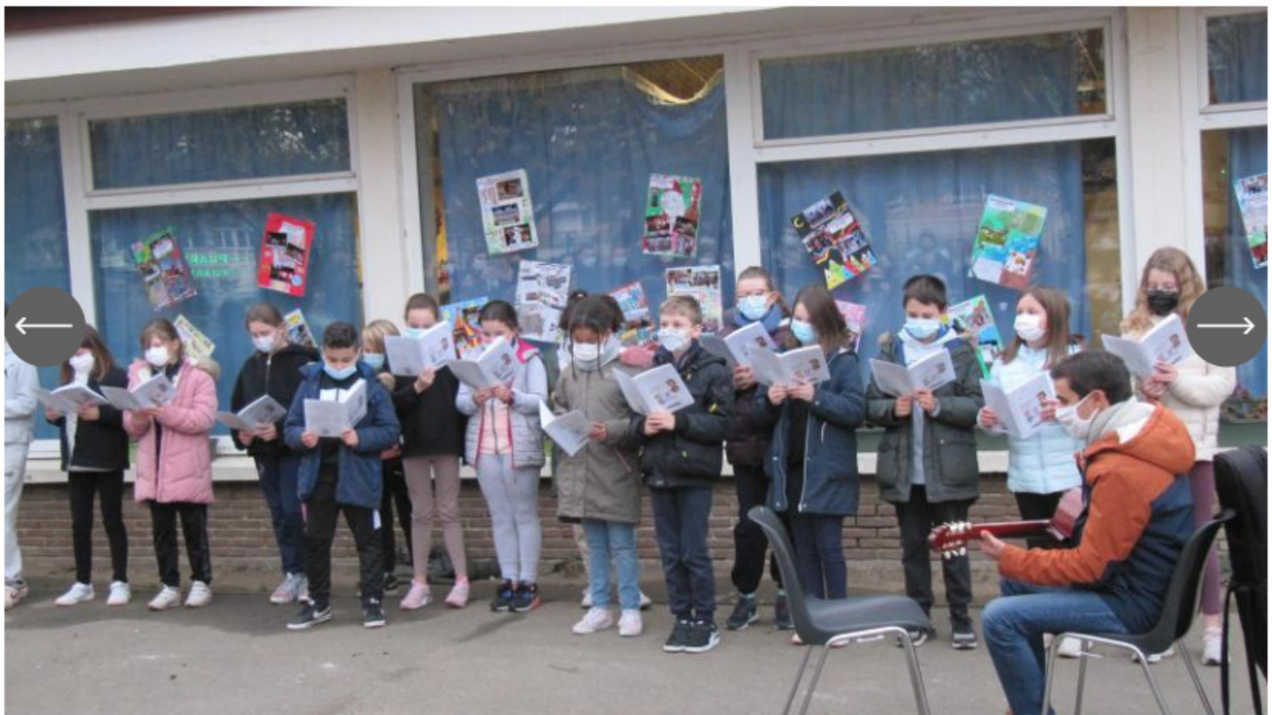
Les élèves de l'école Voltaire-Sévigné ont interprété un chant d'amour pour leur école.

Dans le cadre du Projet éducatif global, une semaine de l'éducation a été organisée fin novembre dans les écoles lommoises sur le thème « Pourquoi j'aime mon école ».